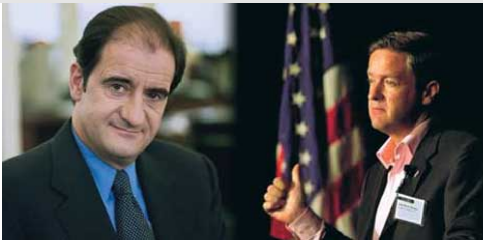
Les anciens dirigeants de Canal+ et Vivendi, Pierre Lescure et Jean-Marie Messier, vont être appelés à témoigner dans le cadre du procès Canal+ contre NDS.