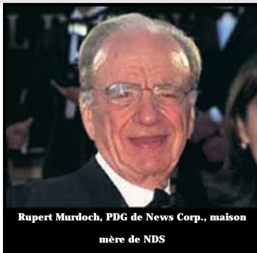
Rupert Murdoch, PDG de News Corp., maison mère de NDS